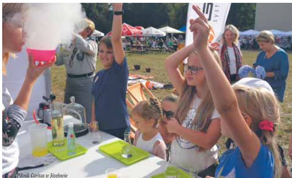
Piknik Caritas w Józefowie