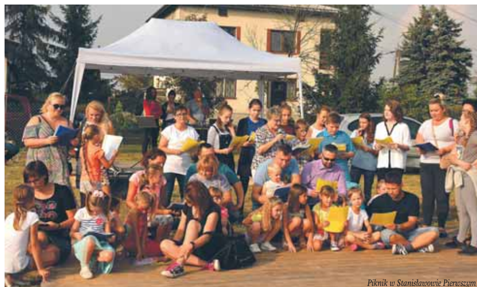
Piknik w Stanisławowie Pierwszym