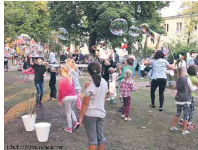
Piknik w Zegrzu Południowym